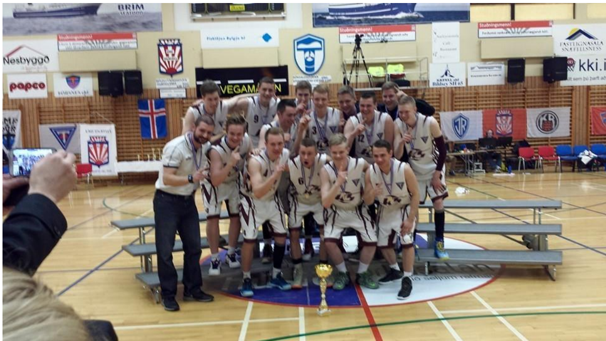
Unglingaflokkur fagnar Íslandsmeistaratitli sínum